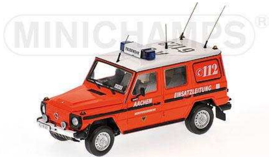
400038090 MERCEDES-BENZ 230 GE (W460-461) - "BERUFSFEUERWEHR AACHEN"

Bestehend aus 97 Einzelteilen mit 166 Dekorationen: