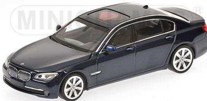
431027001 BMW 7-SERIES (F02) - 2008 - BLUE L.E. 1008 pcs.